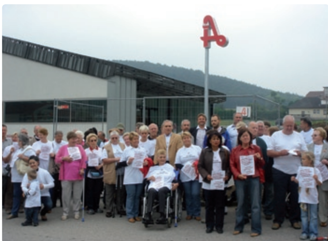
Vor der Apotheke,...

Eine Rollstuhlpatientin, die wir gemeinsam verkehrt über den Göttweiger Sattel gezogen hatten, stellte mir knapp vor dem Ziel die Frage: „Glauben Sie an einen Erfolg unserer Aktionen?“ Kurz hielt ich aufgrund dieser Direktheit inne, dann folgte meine klare Antwort: „Ja, ich glaube daran. Wir dürfen nur nicht aufgeben!“