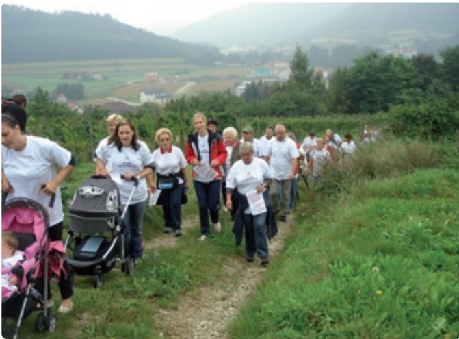
Durch die Weinberge...