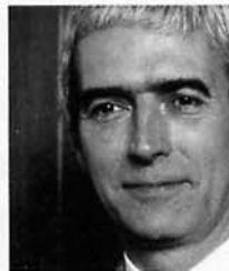
Euler: „Wir wollen den Informationsfluss verbessern“