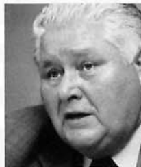
Dorner: „Maschenwerk, mit dem alle Ärzte leben können“