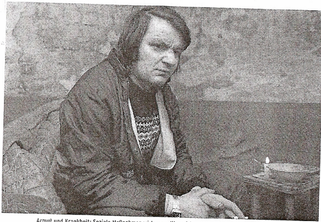
Armut und Krankheit: Soziale Maßnahmen wirken positiv auf Gesundheit und Gesundheitskosten

Die Folgen von Armut, niedriger Bildung, schlechter Gesundheit und Entsolidarisierung waren Thema einer Podiumsdiskussion des Hausärztesverbandes.