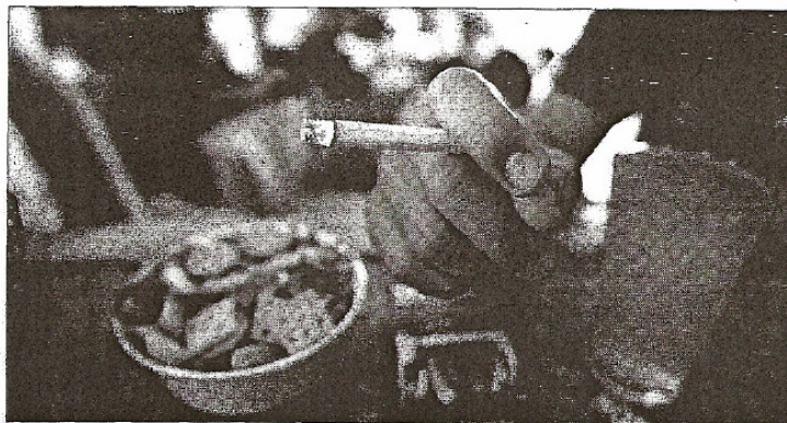
Nur eine Minderheit von 19 Prozent will ein absolutes Rauchverbot in Lokalen.

Allerdings sind nur 19 Prozent der Österreicher für ein totales Rauchverbot in Lokalen. Die Mehrheit (59 Prozent) ist dafür, dass der bisherige Weg fortgesetzt wird, 70 Prozent der Österreicher plädierten für räum-